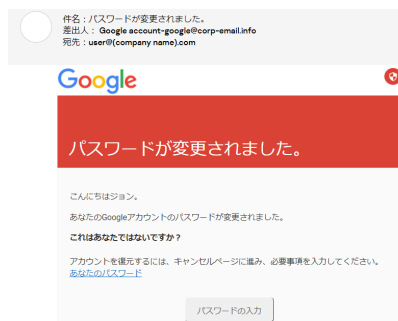
模擬フィッシングメール